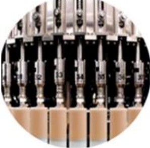
Filling Machine Line