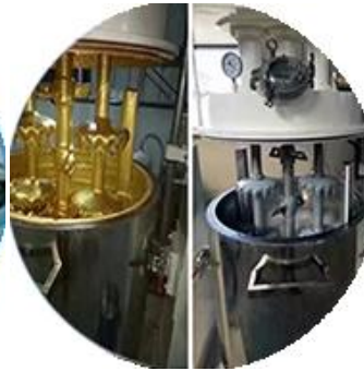
Toplu üretim hattı