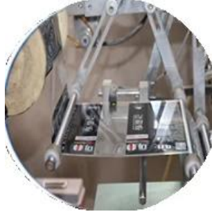
Film kaplı makine