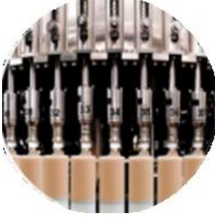
Dolum Makinesi Hattı