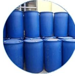
Gerçek malzeme stoğu