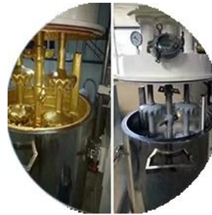
Toplu üretim hattı