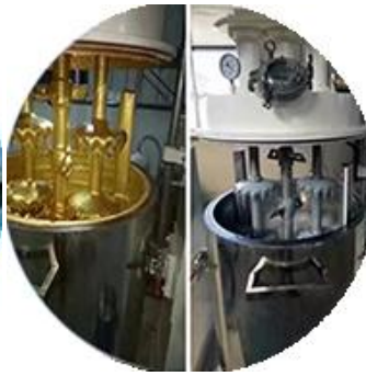
Toplu üretim hattı