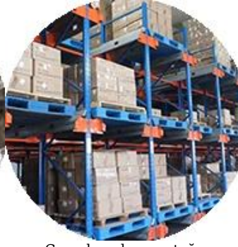
Gerçek malzeme stoğu