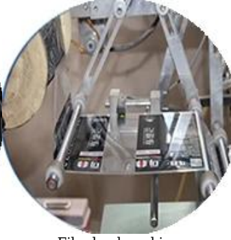
Film kaplı makine