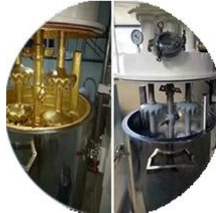
Dozaj Üretim Hattı