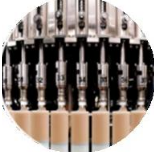
Dolum Makinesi Hattı