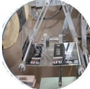
Film kaplı makine