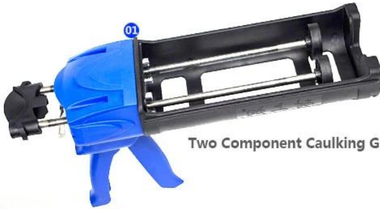
Two Component Caulking Gun