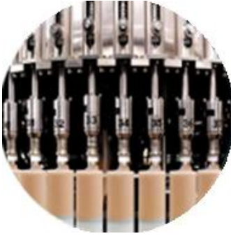
Dolum Makinesi Hattı