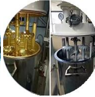
Toplu üretim hattı