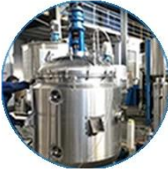
Krema makinesi hattı