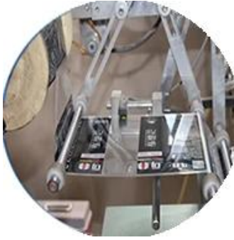
Film kaplı makine