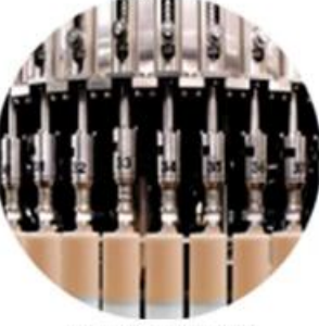
Filling Machine Line