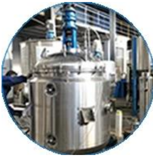
Krema makinesi hattı