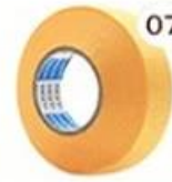
07 Masking Tape