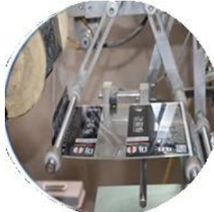
Film kaplı makine