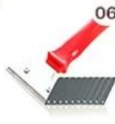
06 Perching Knife