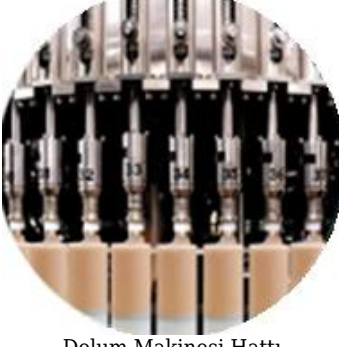
Dolum Makinesi Hattı