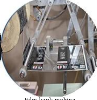
Film kaplı makine