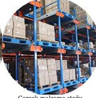
Gerçek malzeme stoğu