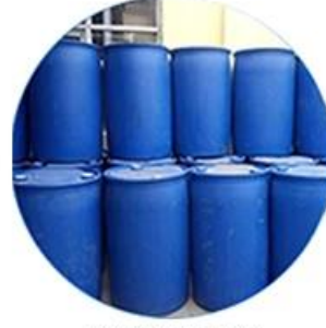
Real Material Stock