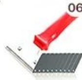
06 Perching Knife