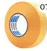
07 Masking Tape