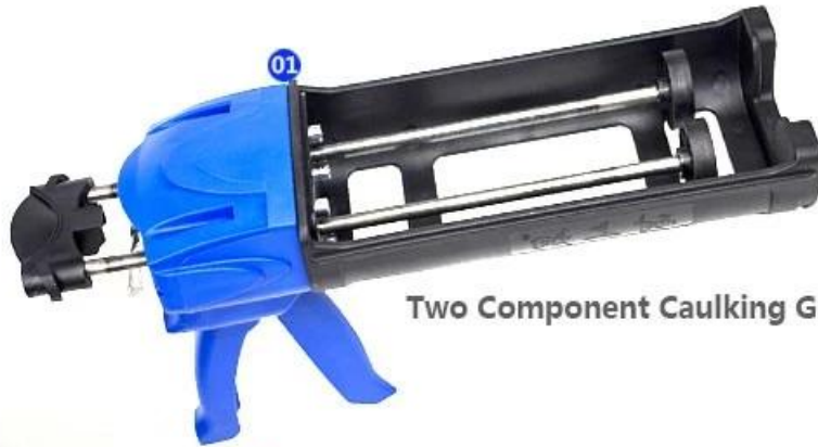
Two Component Caulking Gun