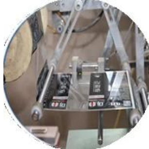
Film kaplı makine